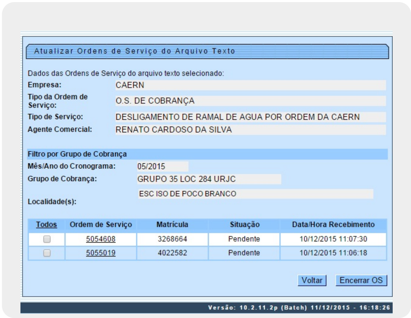
Tela 3 - Atualizar Agente Comercial

Acima, é possível tanto efetuar a consulta quanto atualizar a ordem de serviço, através do botão Encerrar OS .